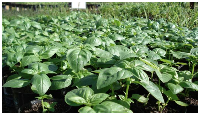
FIGURA 1 - Cultivar de manjeriço-italiano

Nas figuras 1, 2 e 3, são ilustradas alguns cultivares de manjeriço, que é o grupo com maior número de variações