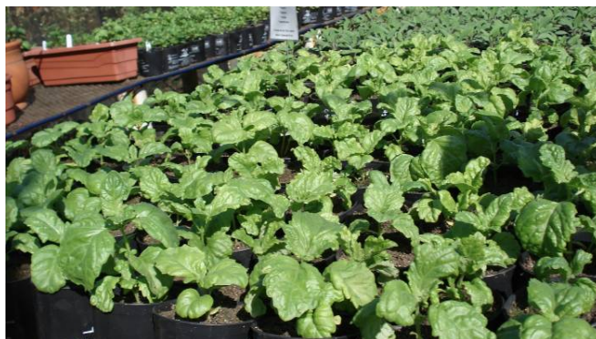
FIGURA 3 - Cultivar de manjeriçao-italiano