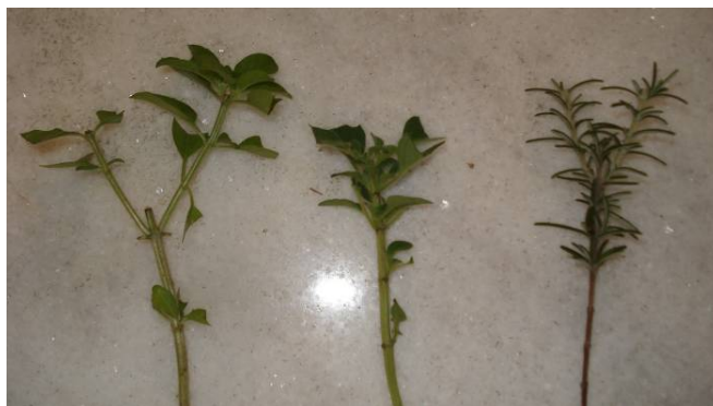
FIGURA 5 - Estacas de galho de manjerições e alecrim, última à direita