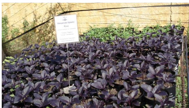
FIGURA 2 - Cultivar de folhas roxas de manjeriço-italiano