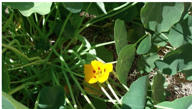
FIGURA 8 - Capuchinha ( Tropaeolum majus ) Fonte: FURLAN, 2007.