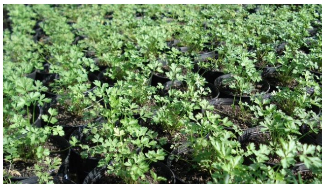
FIGURA 6 - Produção de mudas de salsinha