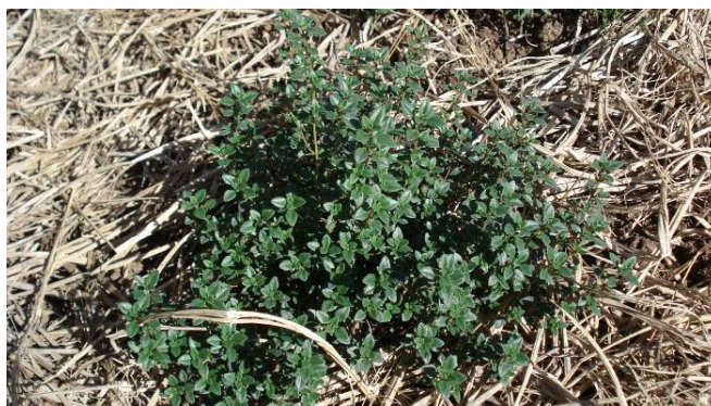
FIGURA 10 - Cultivar de tomilho

O tomilho (FIG. 10) segundo uma lenda antiga, teria nascido das lágrimas da bela Helena de Tróia. Para os gregos era símbolo de coragem. As folhas aromáticas, que são as partes mais utilizadas, possuem sabor amargo e picante tem a forma de ponta de lança e são verde-cinzentas. Seu uso culinário deve ser feito moderadamente, pois seu cheiro é intenso, usando junto a recheios, molhos, sopas, caldos, peixes e carnes. Na medicina é recomendado como anti-séptico e seus usos tem merecido destaque na ciência.