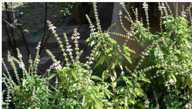
FIGURA 9 - Uma das variedades de manjeriçãõ mais usado no Brasil