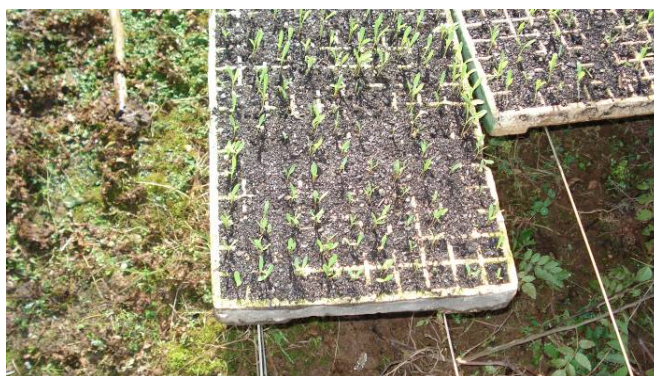
FIGURA 4 - Bandeja de isopor para produção de mudas.

A FIG. 4 mostra uma bandeja de isopor e que é específica para produção de mudas. O substrato pode ser os que são vendidos no comércio, só devendo ter cuidado com a acidez, pois se for muito ácido, poderá prejudicar o desenvolvimento das mudas. Observe o valor no rótulo e o ideal é estar por volta de 6,0 a 6,5.